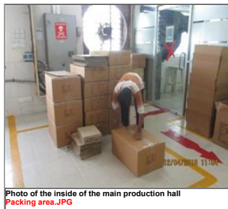
Photo of the inside of the main production hall Packing area.JPG