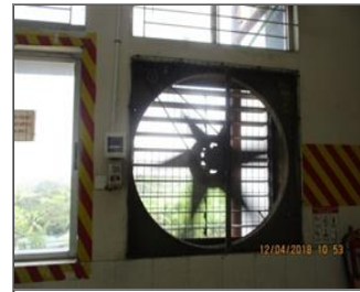
Photo of the inside of the main production hall Exhaust fan.JPG