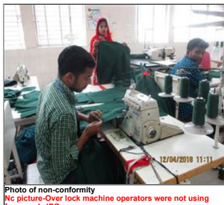
Photo of non-conformity No picture-Over lock machine operators were not using face mask.JPG