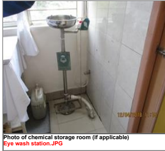
Photo of chemical storage room (if applicable) Eye wash station.JPG