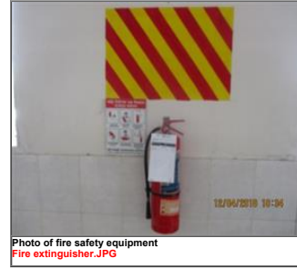
Photo of fire safety equipment Fire extinguisher.JPG