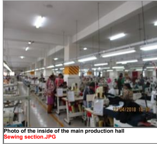
Photo of the inside of the main production hall Sewing section.JPG