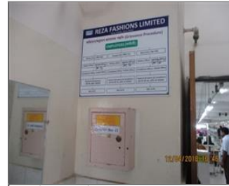
Photo of the inside of the main production hall Suggestion box.JPG