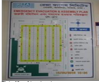
Photo of fire safety equipment Evacuation plan.JPG