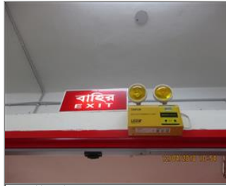
Photo of fire safety equipment Exit sign illuminated.JPG