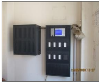
Photo of fire safety equipment Fire control panel.JPG