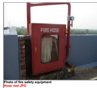
Photo of fire safety equipment Hose reel.JPG