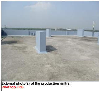
External photo(s) of the production unit(s) Roof top.JPG