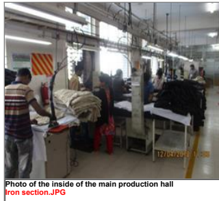
Photo of the inside of the main production hall Iron section.JPG