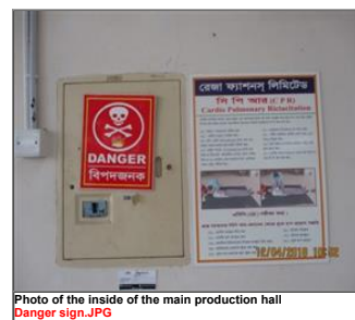
Photo of the inside of the main production hall Danger sign.JPG