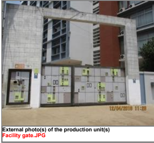
External photo(s) of the production unit(s) Facility gate.JPG