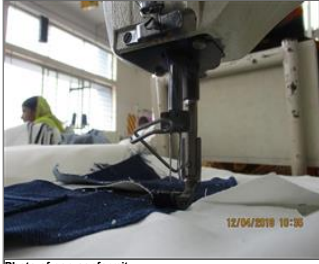
Photo of non-conformity No picture-Needle guard of sewing machines are found displaced.JPG