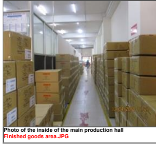
Photo of the inside of the main production hall Finished goods area.JPG