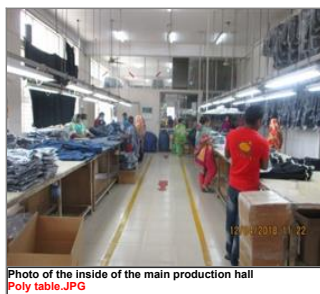
Photo of the inside of the main production hall Poly table.JPG