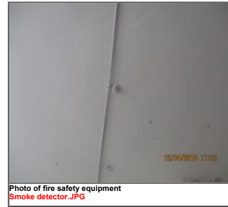
Photo of fire safety equipment Smoke detector.JPG