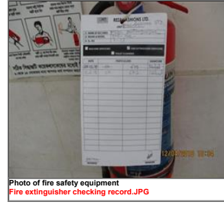
Photo of fire safety equipment Fire extinguisher checking record.JPG