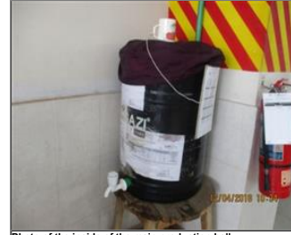
Photo of the inside of the main production hall Drinking water point.JPG