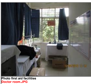
Photo first aid facilities Doctor room.JPG