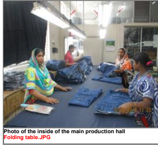
Photo of the inside of the main production hall Folding table.JPG