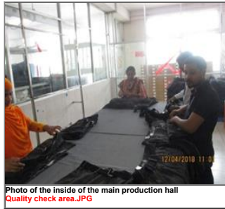
Photo of the inside of the main production hall Quality check area.JPG