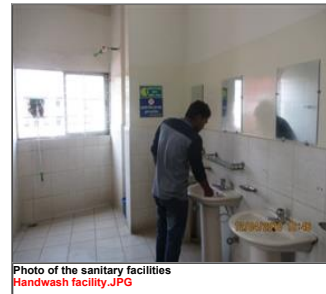
Photo of the sanitary facilities Handwash facility.JPG