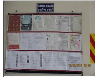
Photo of the inside of the main production hall Notice board.JPG