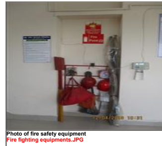
Photo of fire safety equipment Fire fighting equipments.JPG