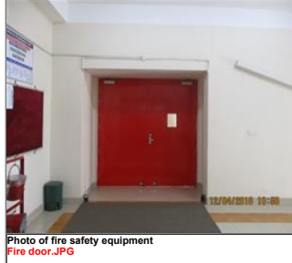
Photo of fire safety equipment Fire door.JPG