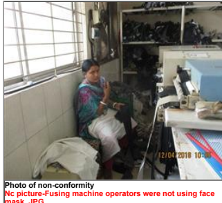
Photo of non-conformity No picture-Fusing machine operators were not using face mask.JPG