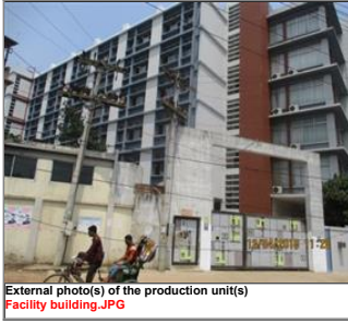
External photo(s) of the production unit(s) Facility building.JPG