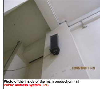
Photo of the inside of the main production hall Public address system.JPG