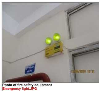
Photo of fire safety equipment Emergency light.JPG