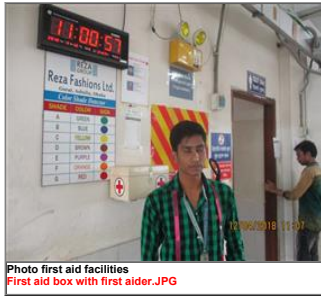
Photo first aid facilities First aid box with first aider.JPG