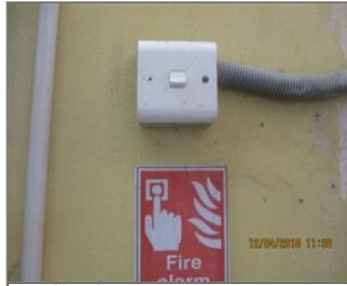
Photo of fire safety equipment Fire alarm switch.JPG