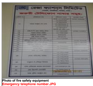
Photo of fire safety equipment Emergency telephone number.JPG