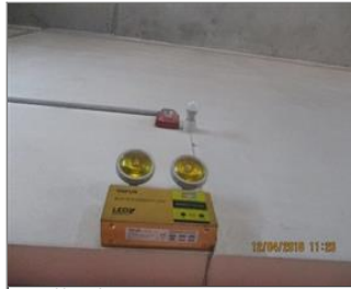
Photo of fire safety equipment Fire bell.JPG