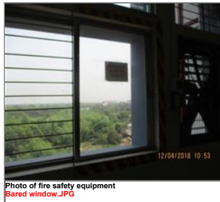
Photo of fire safety equipment Bared window.JPG