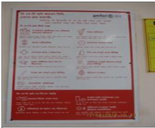
Photo of the code of conduct on display Amfori BSCI COC posted.JPG