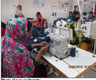
Photo of non-conformity No picture-Eye guard of overlock machines are found displaced.JPG