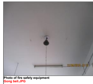
Photo of fire safety equipment Gong bell.JPG