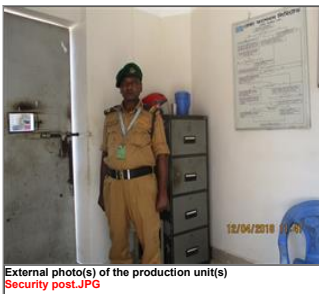
External photo(s) of the production unit(s) Security post.JPG