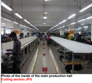
Photo of the inside of the main production hall Cutting section.JPG