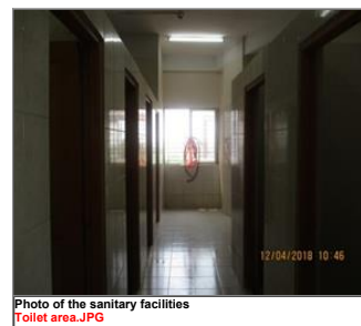
Photo of the sanitary facilities Toilet area.JPG