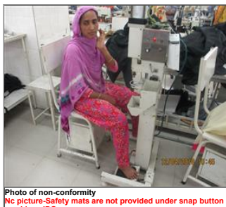
Photo of non-conformity No picture-Safety mats are not provided under snap button machine.JPG